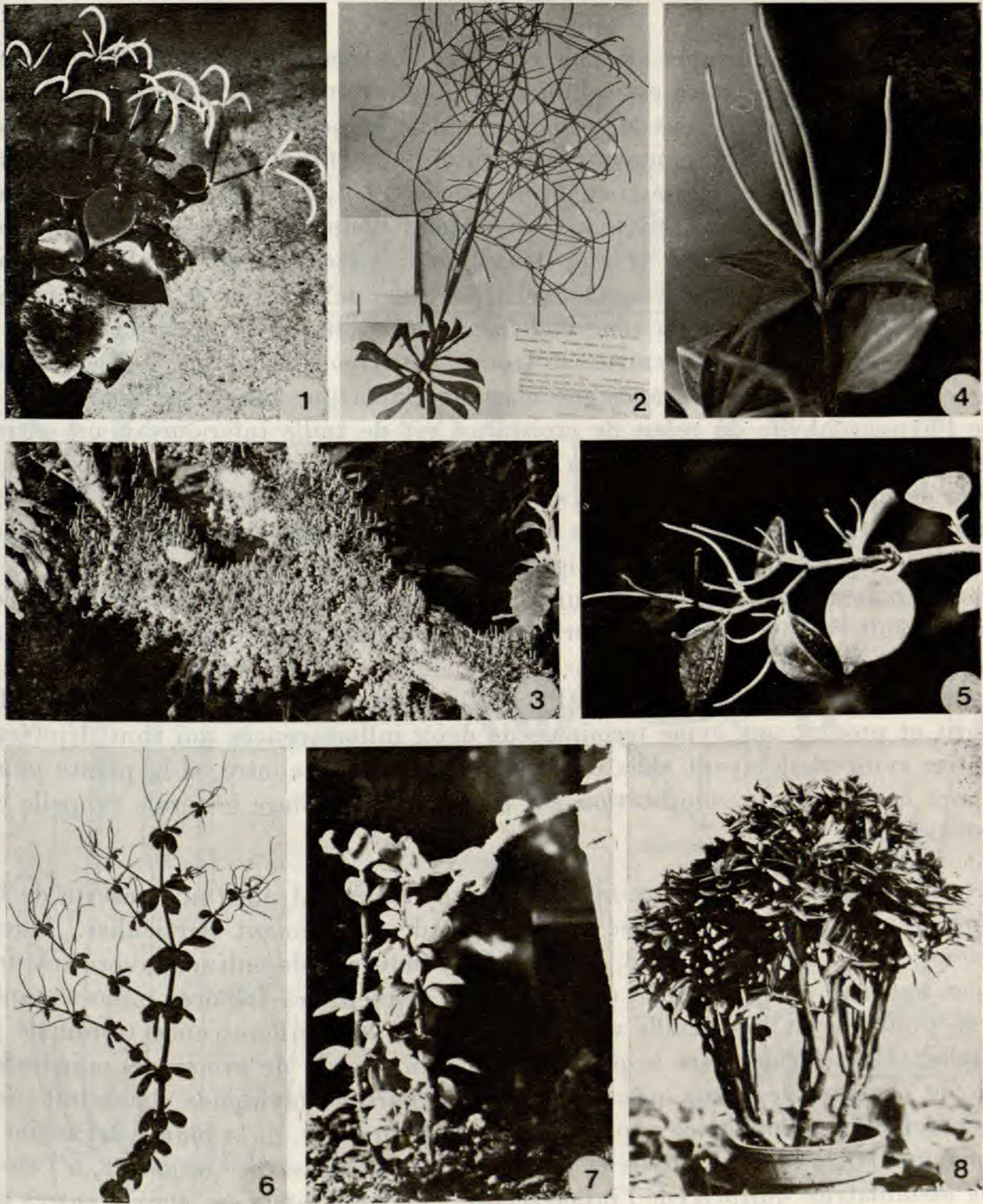
Pl. 2. — Aspect général de quelques espèces de Peperomia Ruiz & Pav. : 1, P. polybotrya H. B. & K. cultivé au laboratoire : tiges dressées présentant des cymes terminales de spadices ; 2, P. dolabriformis H. B. & K. : échantillon Hutchinson 3511 déposé au M.N.H.N. : importance de la phase reproductrice par émission d'une panicule terminale ; 3, P. reflexa A. Dietr. épiphyte sur une branche à Tjibodas (Java) : les tiges très ramifiées forment un manchon fixé autour de la branche par les racines adventives ; 4, P. pereskiaefolia H. B. & K. cultivé au M.N.H.N. : inflorescence terminale et inflorescences latérales à l'aisselle de chaque pièce foliaire réduite du dernier verticille ; 5, P. fernandopoiana C. DC. cultivé dans les serres du M.N.H.N. : détail d'une tige fleurie ; le spadice terminal fleurit en premier puis la floraison est descendante le long de la tige par émission successive de cymes de spadices axillaires ; 6, P. pulchella A. Dietr. cultivé au laboratoire : tiges inflorescentielles montrant une augmentation progressive de la taille des entre-nœuds et des feuilles ; floraison terminale et axillaire sur les tiges latérales de renfort ; 7, P. rubella Hook. cultivé au laboratoire : multiplication végétative par enracinement d'une vieille tige retombant sur le sol ; apparition de jeunes tiges à l'origine d'une nouvelle plante ; 8, P. metallica Lind. cultivé au M.N.H.N. : port en pyramide de la plante.